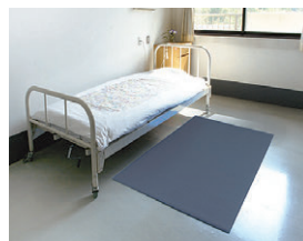
ベッドサイドの転落時の衝撃を緩和します。

●W910×D1520 ●重量約5kg 64-0127-□ F-154-15-□ ¥23,100