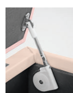
座面の開閉にはソフトダウンスターを採用